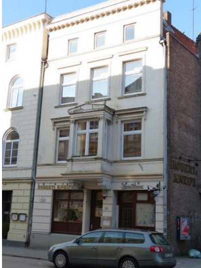
Beckergrube 70 im Jahr 2013