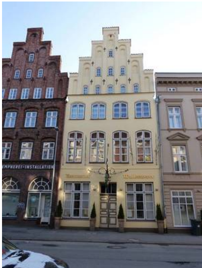
Beckergrube 71 im Jahr 2013