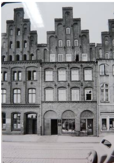
Beckergrube 71 in früherer Zeit, Museum für Kunst und Kulturgeschichte