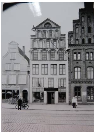
Beckergrube 65 früher, Museum für Kunst und Kulturgeschichte