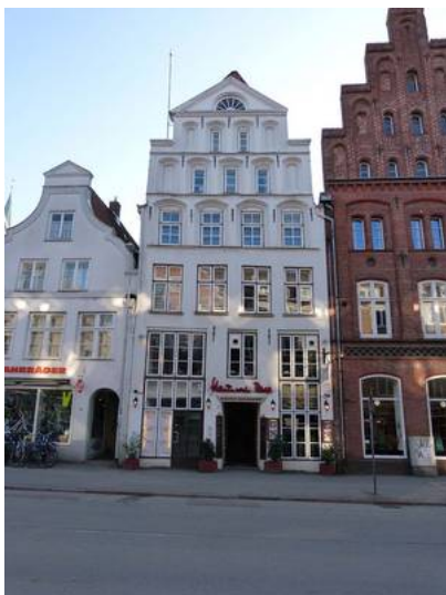
Beckergrube 65 im Jahr 2013