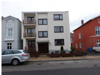
Ein Neubau hat das alte Doppelhaus Bismarckstraße 12 ersetzt.